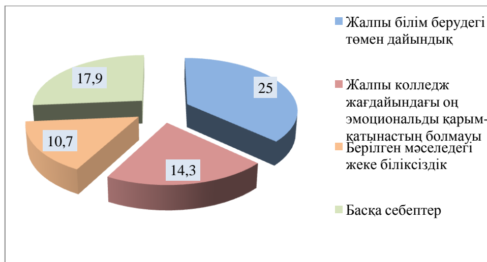
Сурет 1 - Білім алушыларды төмен деңгейде кәсіби бағдарлаудың негізгі себептері

Сонымен қатар жалпы колледж жағдайындағы оң эмоциональды қарым-қатынастың болмауы де назардан тыс қалған жоқ (14,3%). Әсіресе, көзге түскені – «берілген мәселедегі жеке біліксіздік» (10,9%) оқытушылар құрамына сын.