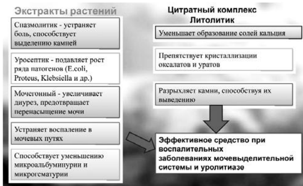
Рисунок 1 – Комплексное действие Уриклара

Уриклар имеет ряд преимуществ – это комплексное воздействие за счет синергического антибактериального, а также диуретического и мощного противовоспалительного эффектов; возможность применения в комплексной терапии с другими уросептическими препаратами для усиления бактерицидного действия; эффективность в профилактике камнеобразования отсутствие зависимости активности от pH мочи (рис. 1).