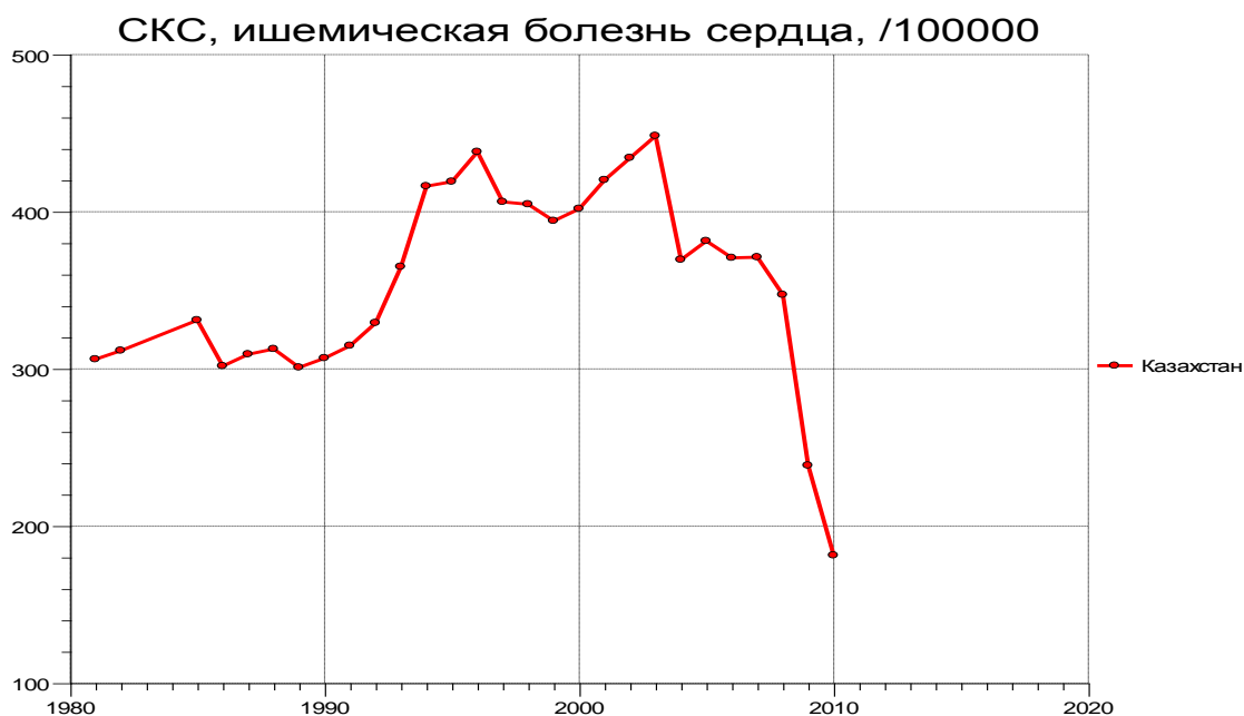
Рисунок 2 - Структура смертности от ИБС в Казахстане

Но, тем не менее, наиболее высокие уровни смертности от ИБС в 2011 году регистрируются в Акмолинской области с показателем 163,74 случая на 100 тыс. населения, при республиканском показателе – 100,27 случая. На втором месте Павлодарская область (158,18), на третьем В-Казахстанская область (155,17), далее С-Казахстанская (147,16) и Жамбылская (115,48) области [4]. ИБС – далеко не гериатрическая проблема: люди молодого, трудоспособного, творчески активного возраста становятся ее жертвами, что нередко приводит к полной или частичной утрате их трудоспособности, снижая, таким образом, трудовой потенциал общества. Немаловажен факт снижения рождаемости в ряде регионов, что может явиться одним из важнейших факторов формирования тяжелой демографической ситуации в стране.